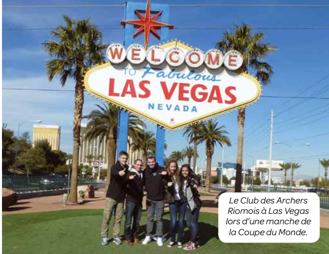
Le Club des Archers Riomois à Las Vegas lors d'une manche de la Coupe du Monde.

Si la volonté politique est d'ouvrir la pratique sportive au plus grand nombre, elle est aussi pensée pour accompagner les ambitions. Porté par un tissu associatif dynamique, le sport riomois se porte bien. La diversité de l'offre permet de répondre aux attentes et aux envies de nombreux sportifs. C'est elle qui donne naissance à des vocations et permet de faire éclore de nouveaux talents. Encadrés par des éducateurs passionnés, les futurs champions trouvent à Riom des équipements de qualité. Un élément essentiel pour faire d'une simple passion une véritable ambition.