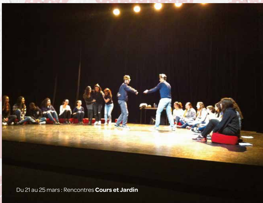
Du 21 au 25 mars : Rencontres Cours et Jardin

Lundi 9 mai, à 18 h 30 à l'Arlequin, Mozac