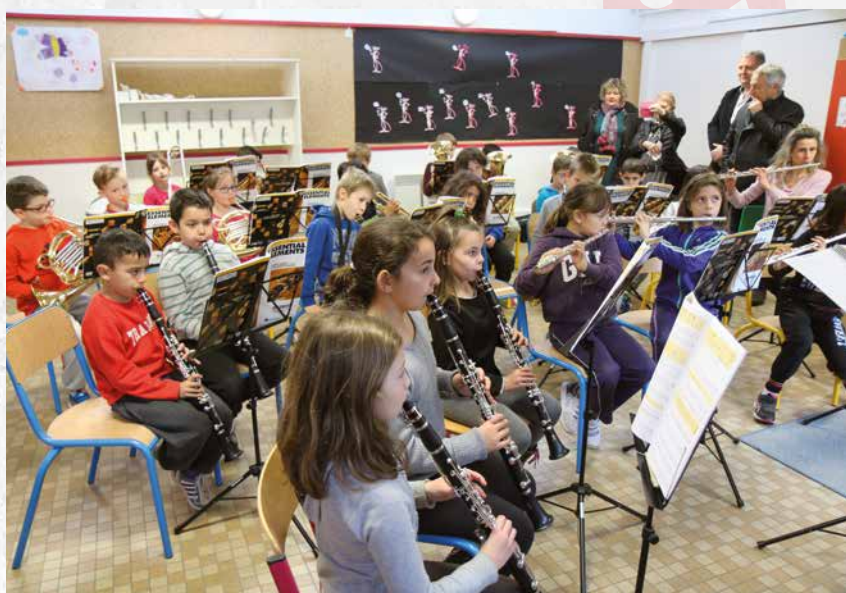
Répétition des élèves de l'école René Cassin dans le cadre de l'opération Orchestre à l'école.