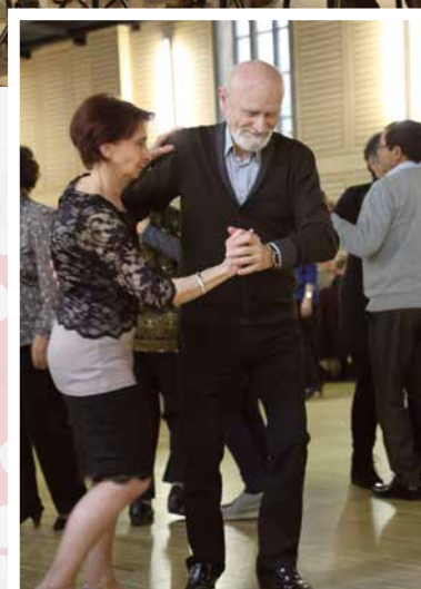
Mardi 8 mars : Repas des aînés , à la salle Dumoulin