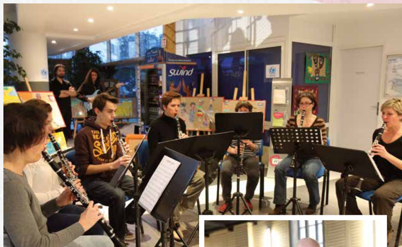
Du 7 au 11 mars : Semaine musicale de l'Ecole Municipale de Musique.